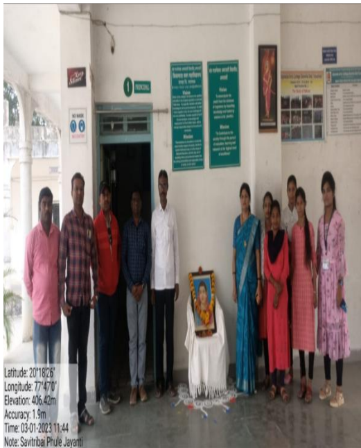
Latitude: 20°18'26" Longitude: 77°47'0" Elevation: 406.42m Accuracy: 1.9m Time: 03-01-2023 11:44 Note: Savitribai Phule Jayanti